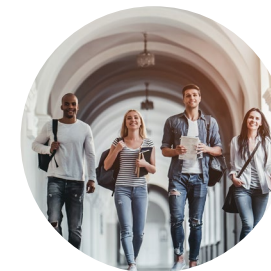
Studenti & Scuole

Condominio Solutions è un facilitatore di contatti per il mondo del condominio. In particolare organizza eventi appositamente studiati per far incontrare amministratori, aziende e consulenti che lavorano ogni giorno per il benessere dei condomini e dell'ambiente in cui vivono e operano.