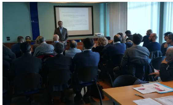
* Seminario con i Vigili del Fuoco di Milano