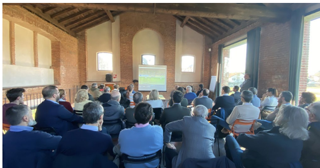
* Seminario con i Vigili del Fuoco di Monza

Iniziati nel 2019 , continueranno nel 2020 con altri 4 incontri in Lombardia e Piemonte .