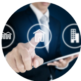
Amministratori di condominio