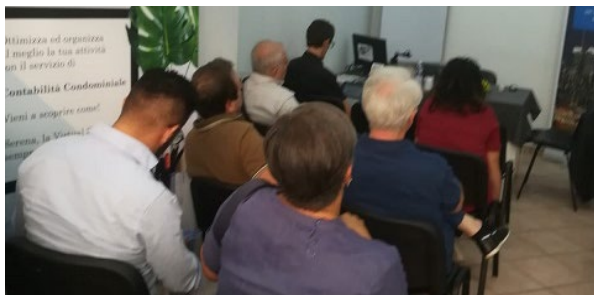
* ANAPI in tour Salerno 27 Settembre 2019

Nel 2019 per ANAPI Condominio Solutions ha organizzato una decina di convegni da Nord a Sud in diverse province italiane, mentre per il 2020 sarà partner di APAC .