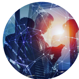
Associazioni & Enti